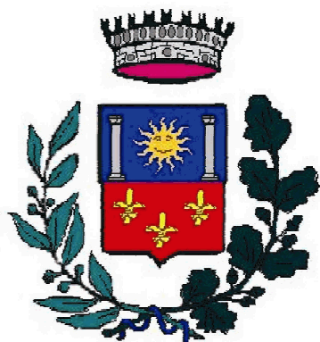
COMUNE DI DORNO