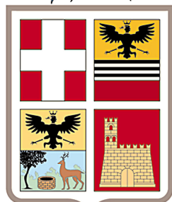
PROVINCIA di PAVIA